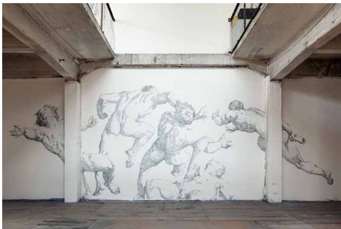
Chléb a sůl, Baptiste Debombourg, 2011